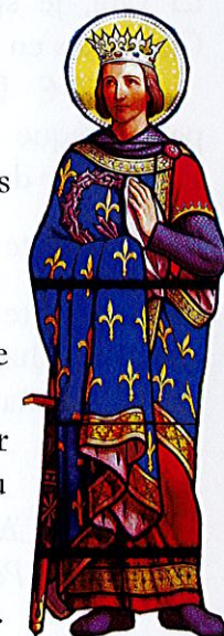
Saint Louis, patron du chapitre cathédral