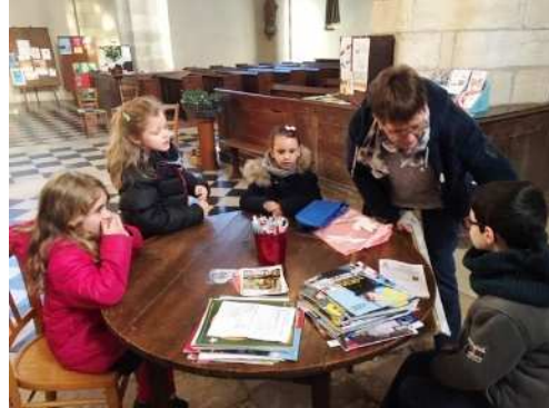
Eveil à la Foi