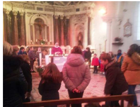
Ci-dessus et ci-dessous : Enfants du catéchisme