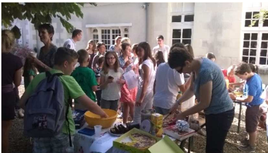
Un rassemblement festif à la Maison Ste Anne

Lundi 3 : 19h30 : Assemblée Générale de l'association Maison Ste Anne (AEP). 16 rue Lecoq à Onzain Toute personne utilisant ou appréciant ce lieu est cordialement invitée.