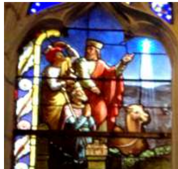
Epiphanie détail de vitrail à Onzain

Rappel : Le Père Bissy sera absent les 20,21,22 janvier (cours à Paris)