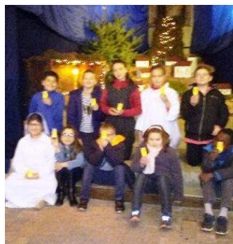
Enfants du catéchisme devant la crèche à Herbault

Pendant tout le temps de l'Avent, Noël s'est préparé dans les différentes paroisses de l'ensemble pastoral.