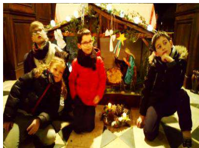
devant la crèche à Veuves