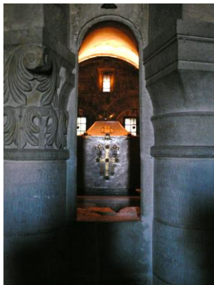
© J.L. Bonté Chasse de saint Benoît Abbaye de Fleury

Quand nous venons à Lourdes servir nos sœurs et frères malades ou âgés, nous venons en communauté, communauté diocésaine, communauté hospitaliers - pèlerins accompagnés. Les pèlerins malades ou âgés ont une place particulière, centrale dans cette communauté. On le voit encore plus lorsque les jeunes viennent donner un coup de main pour les déplacements vers les sanctuaires. La maladie ou l'âge met nos frères et sœurs souffrants au cœur de la communauté comme une icône du Christ.