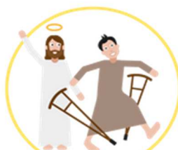
L'annonce du royaume