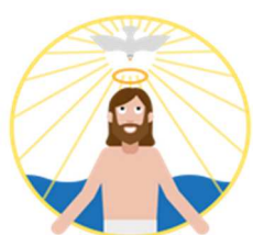
Le baptême de Jésus