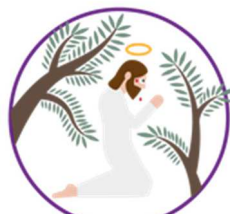
L'agonie de Jésus