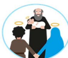
La présentation de Jésus au temple