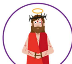
Le couronnement d'épines