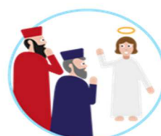
Le recouvrement de Jésus au Temple