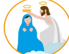
Le couronnement de Marie