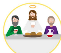
L'institution de l'eucharistie