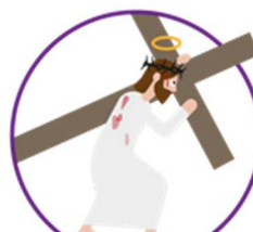
Le portement de croix