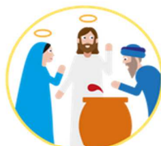
Les noces de Cana