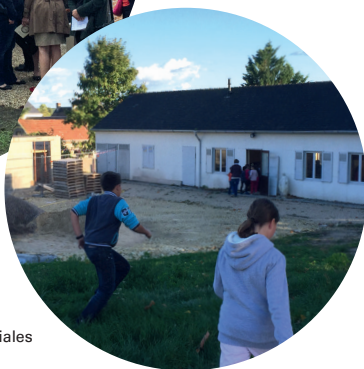
Montrichard : agrandissement des salles paroissiales