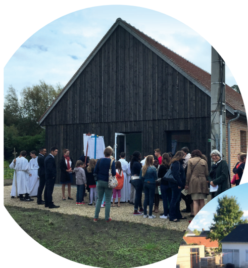
Saint Viâtre : maison paroissiale