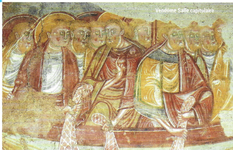
Vendôme Salle capitulaire

Samedi 11 septembre, Le Plessis-Dorin - Découverte du Perche-Gouet. 10h église du Plessis-Dorin, 11h30 église de Saint-Avit (fresque inédite de St Sébastien), 12h30 pique-nique étangs de Boisvinet (Le Plessis -Dorin), 14h château de Glatigny (chapelle et communs), 15h église de Souday (les murs décrivent 1000 ans d'histoire). B.Malcor Tel : 06 77 60 72 69.