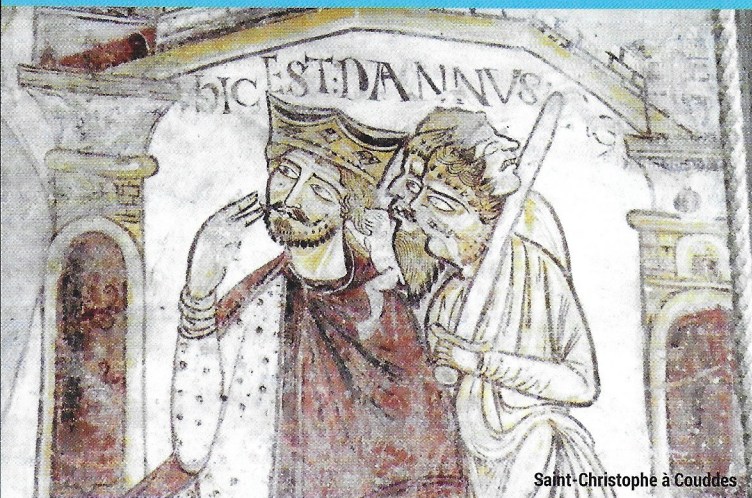
Saint-Christophe à Couddes

RDV devant l'église, sauf précisions particulières