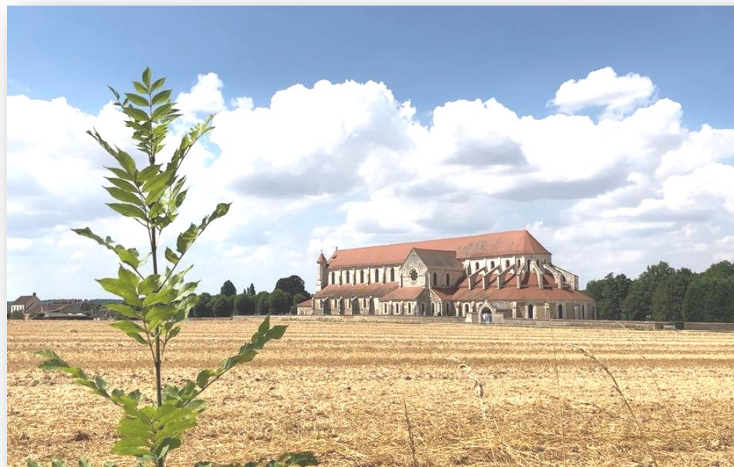
Abbatiale cistercienne du 12ème siècle